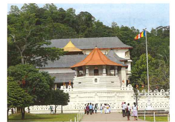
仏歯寺(キャンディ)