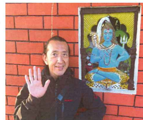
ケン ハラクマ先生

*ケン ハラクマ先生によるヨガレッスンが含まれています* (ケン ハラクマ先生のサイン入り修了証が発行されます)