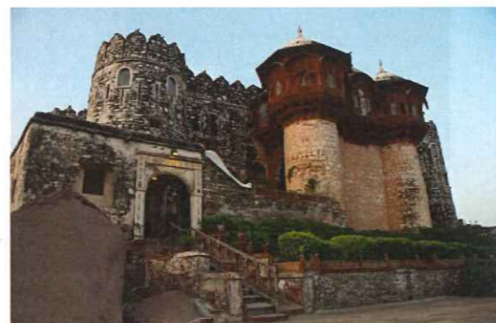
フォート・ケジャルラ

この村は丘の上にあるフォート・ケジャルラで知られており、壮大な要塞は外国人観光客を魅了しています。