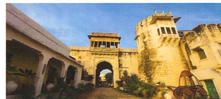
フォート・ケジャラ

本旅行はInternational Yoga Centre ケン ハラクマの旅行企画を基に、株式会社いい旅が旅行企画実施し株式会社スカイエフワールドが受託販売を担当するものです