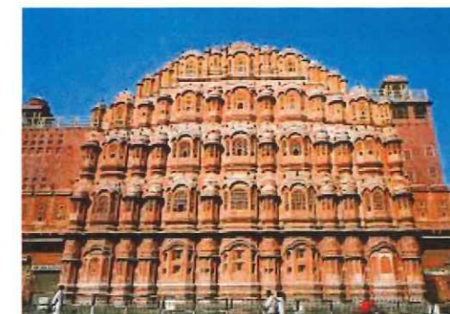
風の宮殿(ジャイプール)